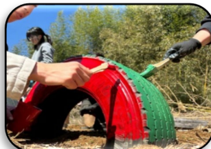
〈廃タイヤで遊具づくり〉