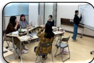
〈課題解決策の検討〉