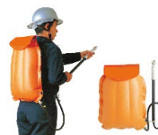
背負い式消火水のう (イメージ)

約20リットルの水が入る水のうに、放水用ノズルが付いており、団員が背負って移動しながら、消防車が近づけない場所での初期消火や残火処理が行えます。