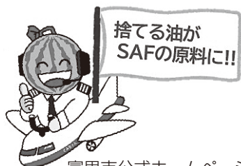
富里市公式ホームページより

A現在、資源回収を実施している店舗と、廃食用油の回収についても、今後の対応について意見交換を行っています。