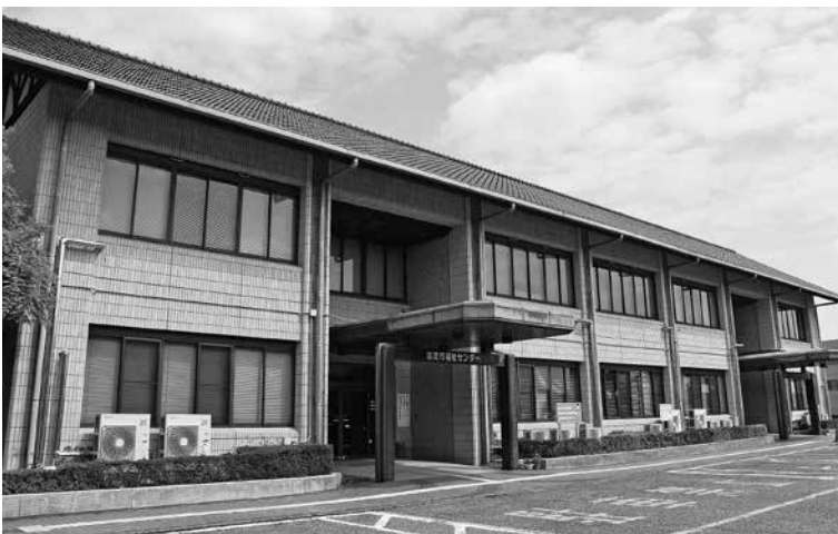
富里市福祉センター

※令和8年9月1日より富里市福祉センター内に成年後見サポートセンターが設置されます！