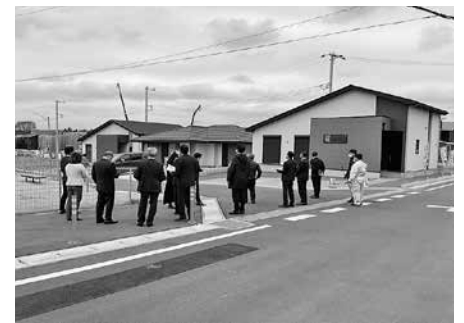
▲道路認定に係る現地調査

答 海外渡航費用の増加などにより、海外渡航を控える傾向が見られていることで、旅券申請件数が当初見込みより少なくなったことが要因と考えられます。