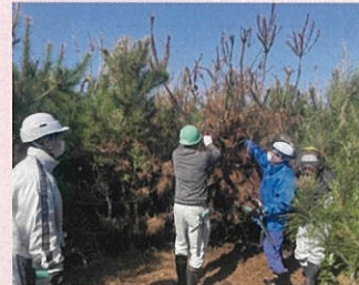
緑の募金の森 (海岸林) の造成 (旭市)