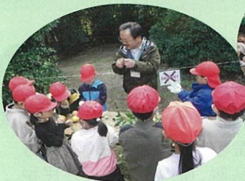
小学校の校外学習支援 (袖ヶ浦市)