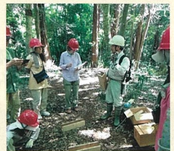
おとなの木育 (千葉市)