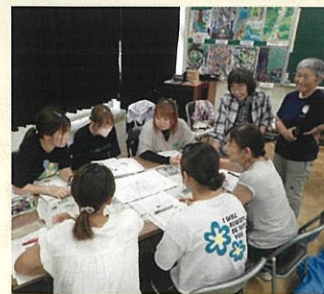
みどりの教室 (袖ヶ浦市)