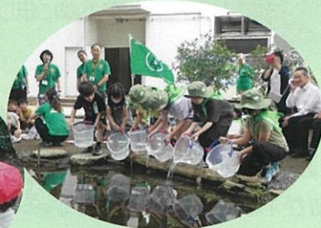
緑の少年団による学校や 地域の緑化活動 (流山市)