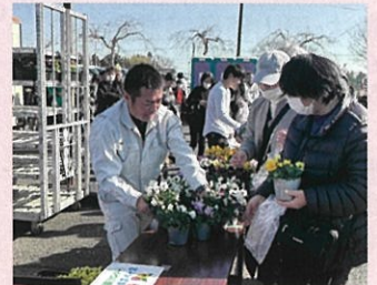
さんむ苺まつり (山武市)