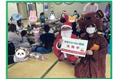
今年は何かな、毎年皆さんプレゼントを楽しみにしています。