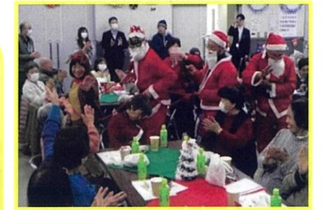
ひよしクリスマス会2025、参加者100名、スタッフ25名、会場は幸せいっぱいにあふれていました。地区社協、民児協、地域包括が主催となり9月から実行委員会を立ち上げ準備します。当日はサプライズサンタの登場で会場は大盛り上がりでした。