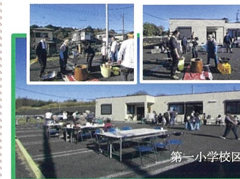
自治会の歳末イベントに参加しました。「よいしょ！」の掛け声とともに会場は笑顔と活気に包まれました。子供から高齢者までが参加し地域の温かい絆を感じる餅つきとなりました。