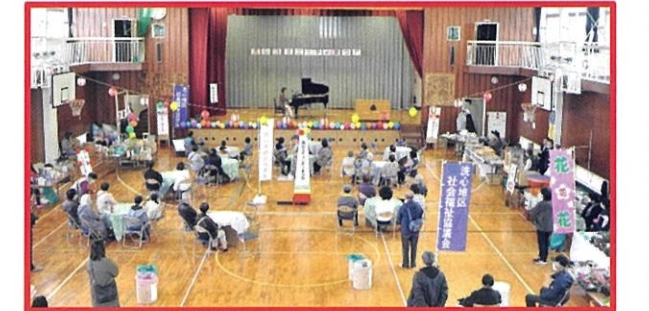
洗心地区の小学校が廃校になり8年が過ぎました。コミュニケーションの場がなくなり寂しいとの声が多くあり、2年前より旧洗心小学校の体育館で地区の皆さまの協力でお祭りを開催しています。