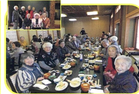
民児協元気塾は年に一度、皆で食事に出かけます。ちょっとおしゃれをして、みんなでバスに乗り会場へ。この日は99歳塾生の百寿の御祝いをしました。皆さんとても楽しそう、100歳目指してみんな頑張れ。