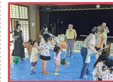
南部地区社協では夏にスイカ割りをしています。大きなスイカはなかなか割れませんが高齢者と子供たちが協力しあって頑張りが割ることが出来ました。