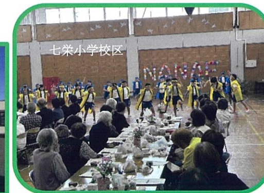
今年は体育館に冷房が設置され快適な中でのより楽しんでいただけるようになりました。子ども達の元気な踊りに高齢者の方々もいっぱいパワーをもらっていました。