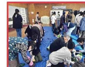
地域の高齢者が浩養小学校の児童と一緒に「寄せ植え」を作りました。おしゃべりをしながら楽しいひと時となりました。