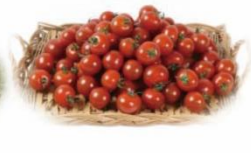
抑制トマト・ミニトマト