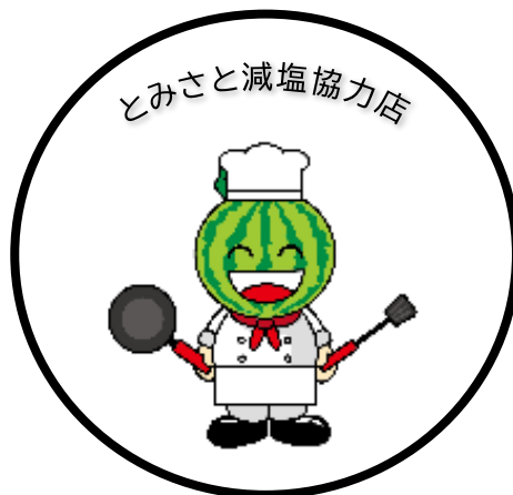
ステッカー(イメージ)