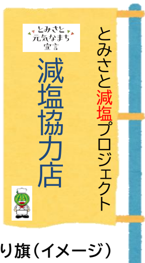
のぼり旗(イメージ)