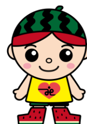
さとしくん 富里市社会福祉協議会 公式マスコットキャラクター