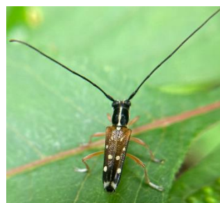
珍しい虫、シラホシカミキリ

毎年、夏に行うホタルの鑑賞会では、参加者に谷津の醍醐味をより味わってもらえるよう、セミの羽化や寝ている蝶やトンボを見つけ出しては皆さんに見てもらっています。子どもも大人もとても興奮するのは言うまでもありません。