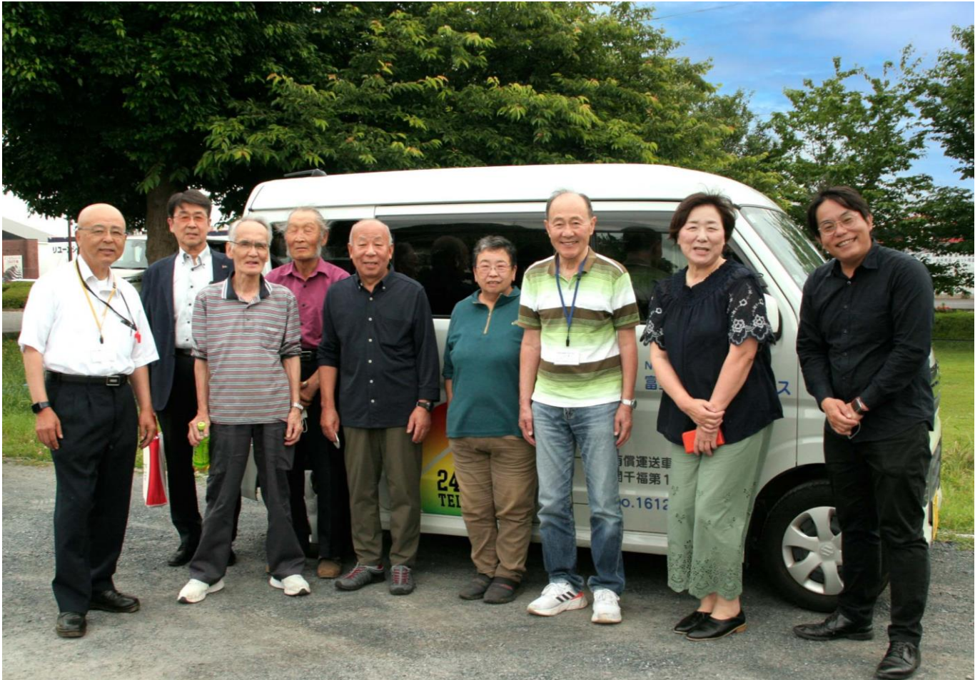
NPO法人富里ピークルサービスの皆さん