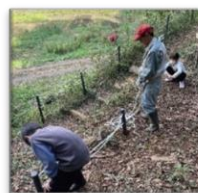
昨年の体験の様子