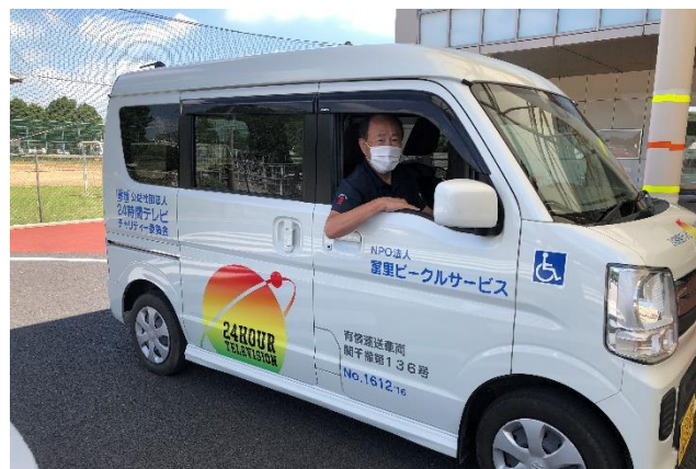
24時間テレビ「愛は地球を救う」より贈呈された車

話し合いを重ねていく中で、高齢者や障害者の移動に「ドアツードア」のサービスが求められていることを確信し、団体の立ち上げに動き出しました。すぐに賛同者や協力者を見つけ、同じような団体を探して勉強会を開き、NPO法人を立ち上げ、無事に移送サービス事業を始めることができました。