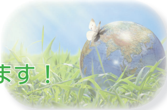
■ クリーンセンター ☎ (93) 4529

富里市の家庭から排出された「もやせるごみ」の量は、令和5年度で8,698トンでした。これを一人当たりの年間排出量に換算すると、175キログラム、1日あたり478グラムの「もやせるごみ」が捨てられていることになります。排出量は次の表のとおり、皆さんのご協力で年々減ってきていますが、引き続きごみの減量にご協力をお願いします！