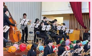
▲クリスマス会（ジャズコンサート）