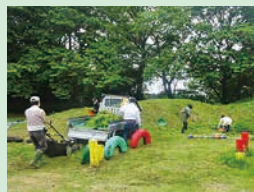
▲地域住民による草刈り作業

第一小学校区まちづくり協議会を中心に、地域防犯パトロール、千葉県道路アダプトプログラム、小学校の除草などの環境美化活動や土砂災害避難訓練などを通じて地域の連携強化に努めています。また、市と合同で開催した土砂災害避難訓練は、実際の災害を想定し、自衛隊・消防・商工業促進協議会など関連部門との連携の確認、住民の意識向上を図っています。