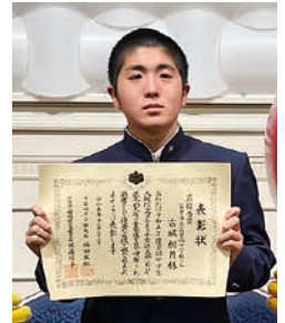
千葉県大会の表彰