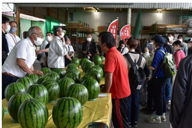
（令和4年度産査定会の様子）