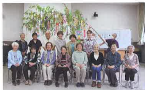
七夕飾りを楽しみました☆彡