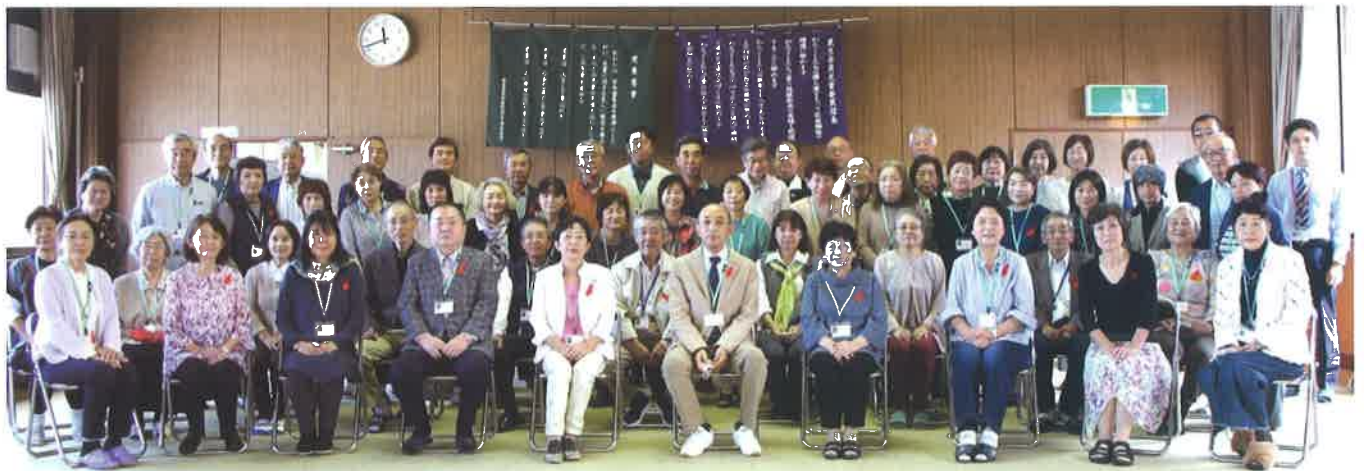
3地区合同定例会、富里市社会福祉センターにて(10/11/2023)