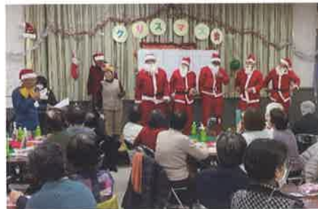
ひよしクリスマス会 2023