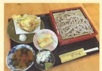
まごころ庵のお蕎麦