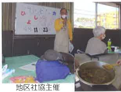
地区社協主催 ひよしかフェカレーの日