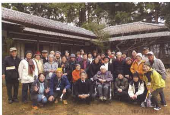
ふれあい講座【末廣農場岩崎邸見学】

日吉台学区 北部地区は定員16名の委員で活動しております。日吉台地区社協の皆さんと連携・協働しながら地域の福祉課題やイベントに取り組んでおります。また単独の事業として高齢者を対象とした 元気塾 (認知症予防のための簡単な勉強と楽しいおしゃべり、交流、憩いの場の提供)を開催しております。日吉台地区は富里市の中でも高齢化の波が一気に押し寄せて来ています。民生委員として関わる事例も多くなり北部地域包括支援センターとの連携も益々求められて来ています。委員自身が元気で充実した活動が出来るよう目指しています。