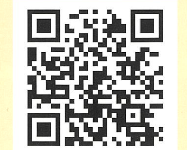
電子版「シルバー人材センター 早分かり読本」

漫画の女性も これを見ていました。 あなたとシルバー人材 センターの相性チェク ができます。