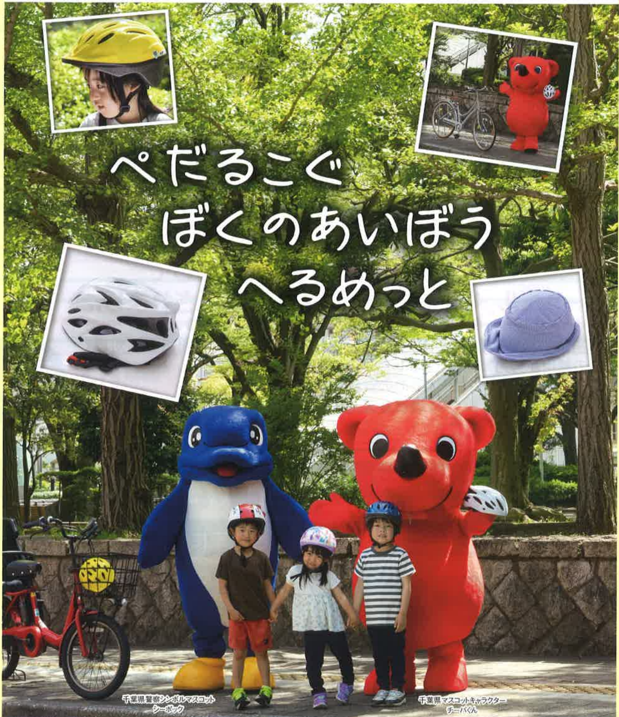
千葉県警交通安全キャラクター シーパドル