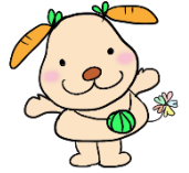
とみさと市民活動サポートセンター とみぼくん

皆さんの身近なところで活動している市民活動団体やボランティアグループの活動を体験してみませんか？