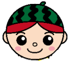
富里市社会福祉協議会 さとしくん