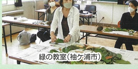
緑の教室(袖ヶ浦市)