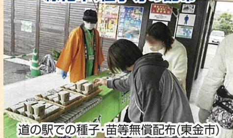
道の駅での種子・苗等無償配布(東金市)