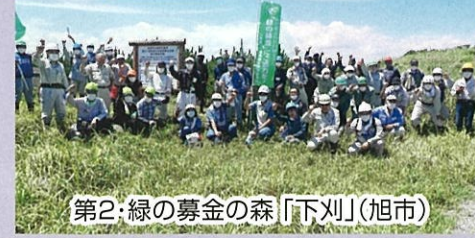
第2:緑の募金の森「下刈」(旭市)