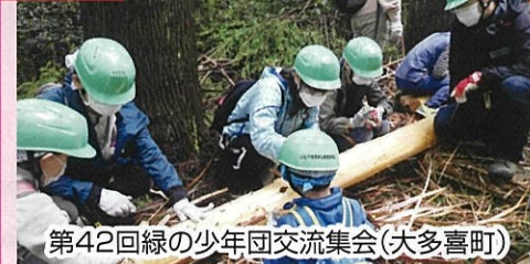
第42回緑の少年団交流集会(大多喜町)