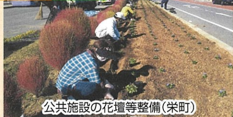
公共施設の花壇等整備(栄町)