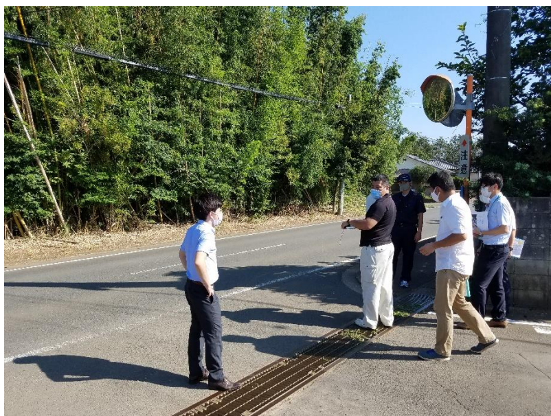
令和2年8月の合同点検の様子