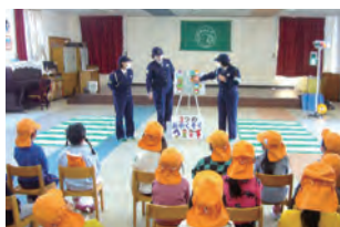
▲交通安全教室の様子