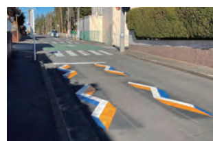
▲横断歩道前での停止を促す対策