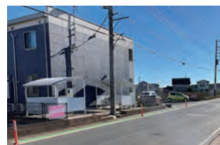
▲グリーンベルト、ポール設置