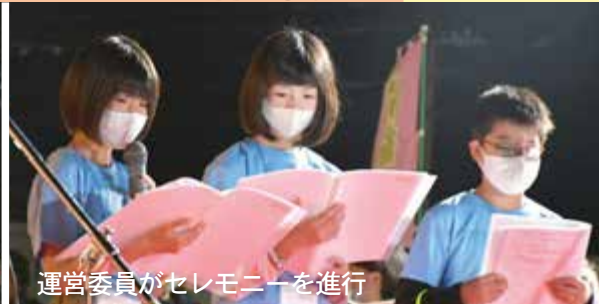
運営委員がセレモニーを進行