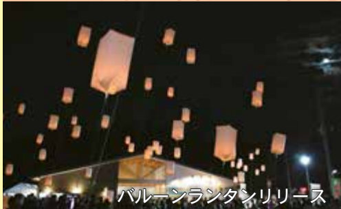
パルーンランタンリリース