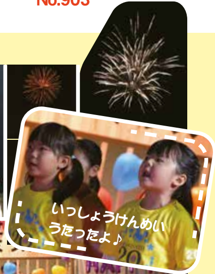
いっしょうけんめい うたったよ♪