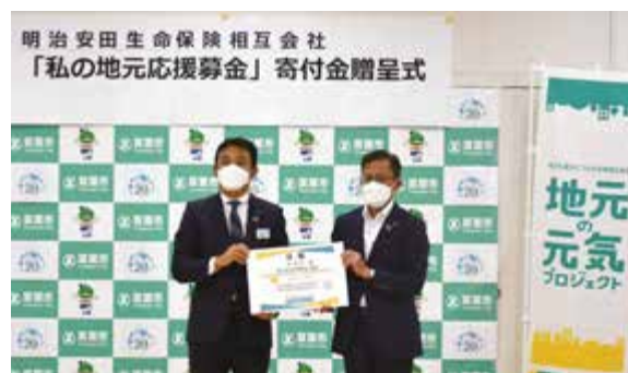
▲明治安田生命保険相互会社成田支社細井支社長、五十嵐市長