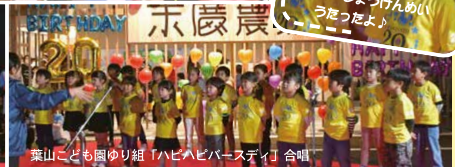
葉山こども園ゆり組「ハピハピパースディ」合唱