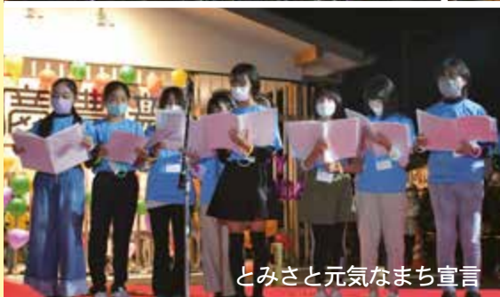
とみさと元気なまち宣言