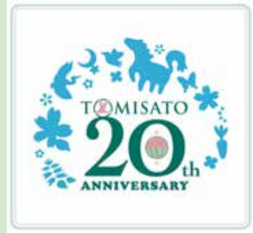
市制 20 周年記念ロゴマーク

市公式ホームページに掲載している「富里市市制 20 周年記念事業冠等の使用に関する取扱要綱」を確認の上、申請書及び申請書類を経営戦略課へ提出してください。