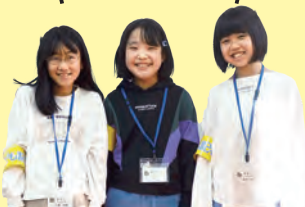
みおり あやか ゆりこ