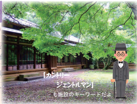
旧岩崎家末廣別邸

かつての「末廣農場」があった大正時代..... 施設のデザインは、当時の農場に建てられていた長屋の牛舎をイメージしています。 隣接している「旧岩崎家末廣別邸」とも、一体感を持たせています。