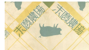
※元となった包装紙