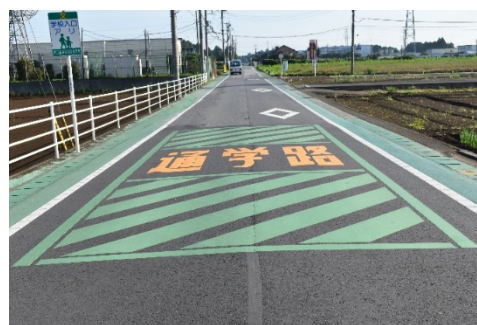
〈グリーンベルト等整備イメージ〉