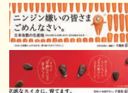
▲日大芸術学部作成

日大芸術学部と連携し、本市の特産である「すいか」と「にんじん」をテーマにしたポスターを作成し、知名度向上のため、電車で中づり広告を行った。