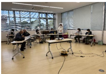
参加者のみなさん