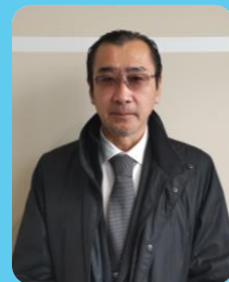
富里市青少年相談員連絡協議会

次代を担う子どもたちのために挑戦し、感動を共にしていく相談員の活動は本当に素晴らしい活動でした。青少年相談員は退任いたしますが、これからも子どもたちの笑顔のために、少しでも支援が出来たらと考えております。最後に、富里市青少年相談員連絡協議会の発展と皆様のご活躍を祈念申し上げ、御礼の挨拶とさせていただきます。長きに渡り、本当に有難うございました。