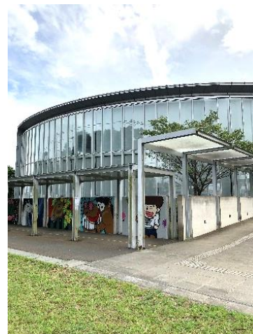
富里市立図書館外観

また、とみさぽニュースレター、サポートセンター登録団体のチラシ等も置いてありますので、図書館に寄られた時は是非、お立ち寄りください。