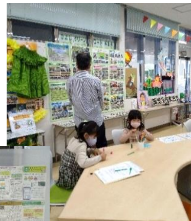
昨年度のフェスタの様子