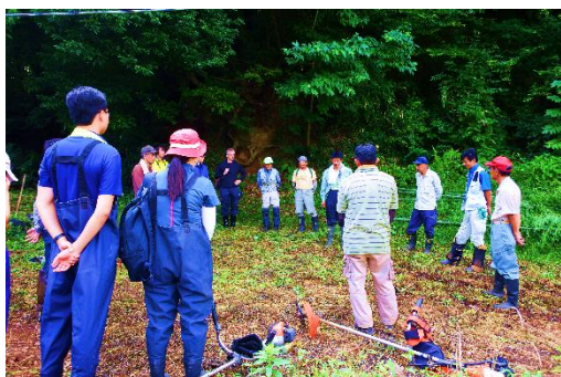
学生との作業前ミーティングの様子

今年度は、富里市市民活動支援補助金も活用し、里山内の歩道整備を行っています。この土地を愛する地域住民の方々には、天気の良い夜はこの場所でお月見をすることもあるそうです。子どもの頃から慣れ親しんでいる場所を大人になっても大事にしているなんて、素晴らしいことですね。