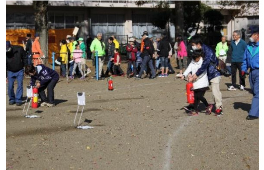
平成27年設立当時の防災訓練の様子