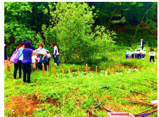
市内こども園の自然教室にて

さらに、他の市民活動団体や、大学、環境研究センターや企業とも連携し、植生調査、貴重植物の保全、ホタルの保全も積極的に行っています。