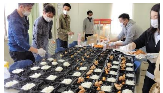
4月には子ども食堂のお手伝いをしました。

コロナ禍になる前は、福祉まつりやひよし夏祭りでポップコーンなどの販売や、市内の福祉施設のイベントのお手伝いをしてきました。昨年は、子どもたちとじゃがいも収穫のイベントを企画していましたが、コロナ禍で実施できなかったため、メンバーで収穫し、富里市社会福祉協議会に寄付をしました。今年は秋に子どもたちとさつまいもの収穫をしたいと、現在企画中です。