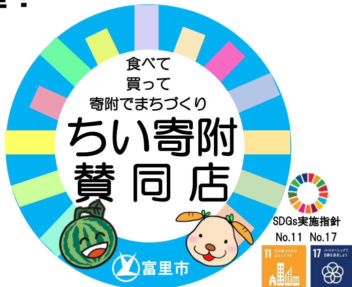
「ちい寄附」ステッカー

今号では、地域の課題解決に直接関われなくても、まちづくりを応援できる「ちい寄附」の仕組みや、実際に参加している事業者の声をご紹介します！「地域を良くしたい！」と手を挙げた団体を、気軽に応援できる社会になったら、課題解決や魅力アップにも拍車がかかり、私たちの安心した暮らしにつながっていくのではないのでしょうか？