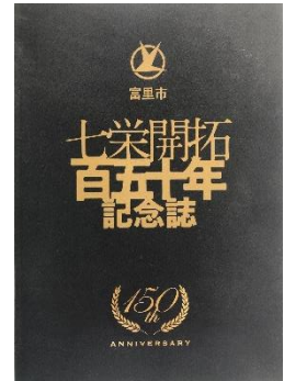
七栄開拓百五十年記念誌

七栄地区の歴史は古く、明治時代の七栄開拓から平成30年で150年を数えました。その節目に「七栄開拓百五十年記念誌」を作り、市長をはじめ多くの方をお招きして記念式典を行いました。