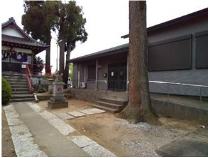
七栄親子まつりの拠点「七栄稲荷神社」

七栄連合区の主な活動は、区民の安心安全な住み良い地域の環境づくりです。地域から出る意見を取りまとめて市に提出しています。