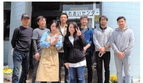
メンバーの皆さん

団体を立上げて3年目になる「富里親心会」。当時の富里市PTA連絡協議会の構成メンバーだった市内小中学校のPTA役員の有志が、「PTAを引退して、せっかくできた繋がりがなくなるのはもったいない！」と集まって立ち上げました。「自分たちも楽しく、子どもたちも楽しく！」をモットーに富里の子どもたちが楽しく過ごせるよう活動をしています。会のメンバーは現在19名。40代のメンバーがほとんどです。