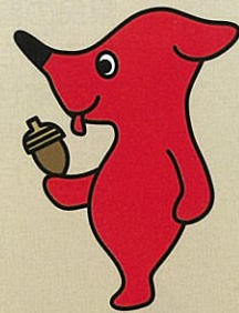
千葉県PRマスコット キャラクター「チーバくん」 千葉県許諾第A1072-7号

みどり豊かで安全な暮らし、そして、持続可能な地球環境を、県民の皆様と一緒に支えていただきたく、緑の募金に御協力をお願いいたします。