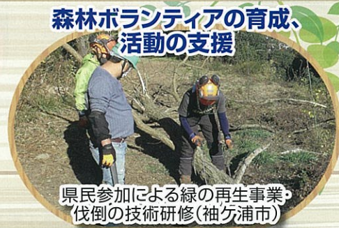
森林ボランティアの育成、 活動の支援