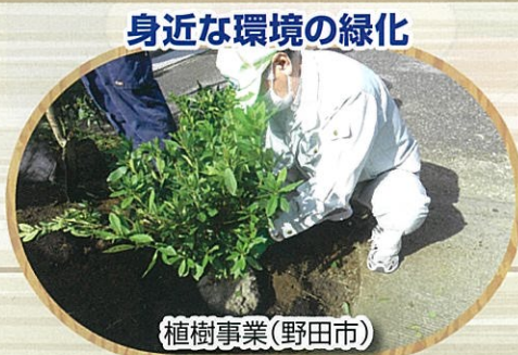
身近な環境の緑化