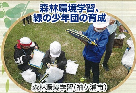
森林環境学習、 緑の少年団の育成