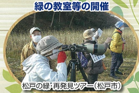
緑の教室等の開催