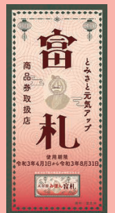
▲取扱店舗ポスター

※商品券の購入・使用の際は、新型コロナウイルス感染症の感染防止対策にご協力をお願いします。