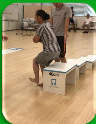
【立ち上がりテスト】