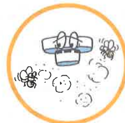
ホコリや小さな虫