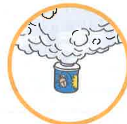
くん煙式殺虫剤など