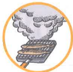
調理時の煙や湯気