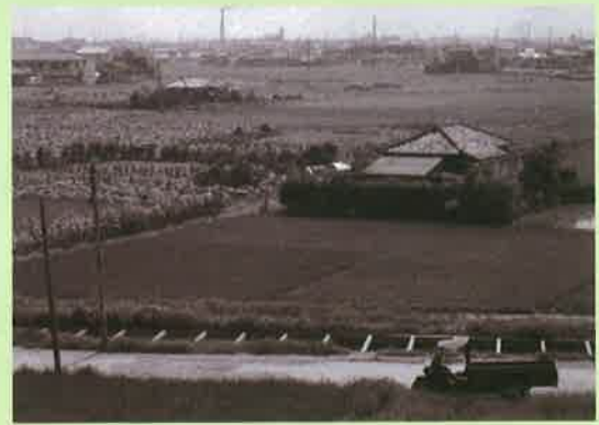
当時の東京都葛飾区