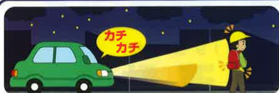
車の「ライト」早めの点灯、 小まめな切り替えで横断者を早期発見