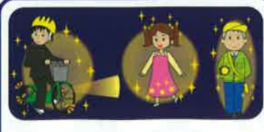
横断者も反射材等で 「ライト」アップ