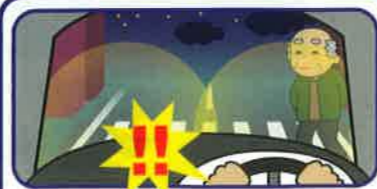
「ライト」(右)からの 横断者にも注意