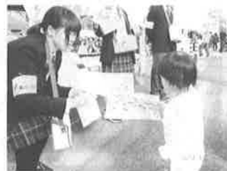
富里高校生徒による街頭募金