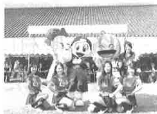
第31回富里市福祉まつり