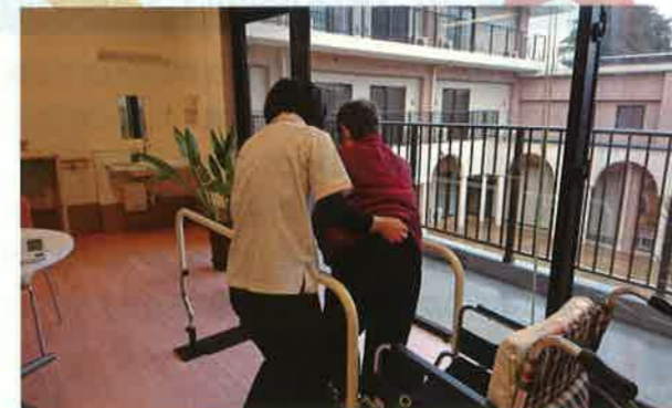
リハビリボールを設置したおかげで、みなさんの体機能維持のリハビリが安全にできるようになりました。 ときわの杜(佐倉市)