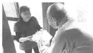
独居高齢者への給食サービス