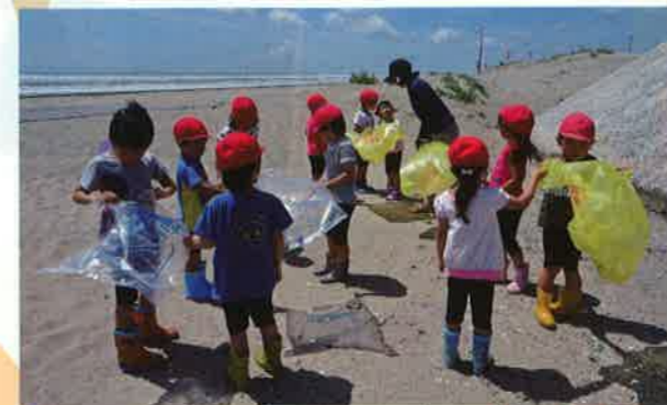
子ども達による町の美化活動に。砂場をみんなで綺麗にしました。 海岸クリーン活動(九十九里町)