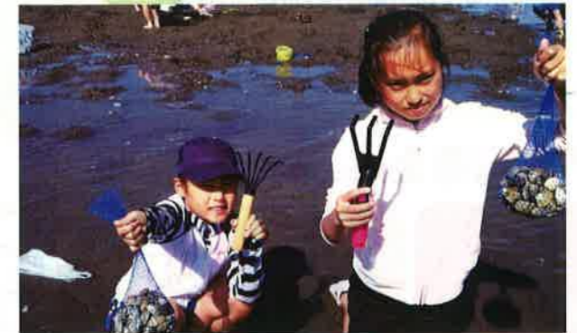
親子ふれあい事業として潮干狩りに行きました。家族にとって楽しい思い出が増えました。 千葉県母子寡婦福祉連合会(千葉市)