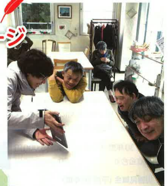
タブレットを購入することで、利用者の意思決定の手助けに使われます。 太陽(ひ)のしずく(富津市)