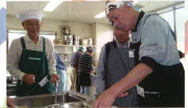
「男の料理教室」を開催。高齢者の社会参加と生涯学習をテーマに事業を実施しています。 香取市社会福祉協議会(香取市)

千葉県では毎年 2,600件以上 の助成を行っています。これからも、 みなさんの募金 がたくさん 困っている人たちの「ありがとう」 に変わるよう、活動していきます。