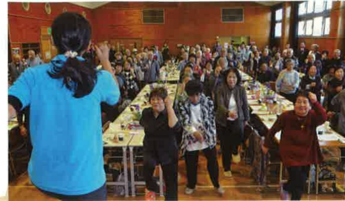
みんなで食事を囲んだり、運動をすることで高齢者のつながりが生まれ、健康維持にも役立ちます。 ふれあい食事会(白井市)