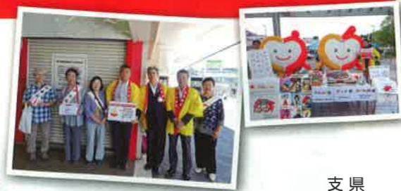
県域で活躍する福祉団体の支援・災害支援に

共同募金は計画募金です。集めてから「行き先」を決めるのではなく、集める前に団体・施設などから要望を受けます。それらをもとに、 寄付者のみなさまに理解と共感を得られる 助成計画をたて、募金目標額を定めます。募金目標額とは、 支援が必要なおところに助成支援が行き渡るよう、寄付を募る 共同募金会の努力目標なのです。