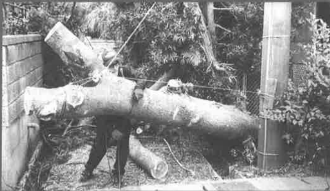
【敷地の倒木撤去作業】