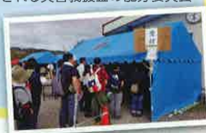
北海道胆振東部地震

義援金は被災道府県共同募金会に送金し、被災地それぞれの行政、共同募金会、日本赤十字等で構成される災害義援金の配分委員会において定める配分基準に基づき各市町村を通じて被災者に配分されます。