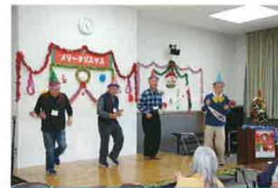
元気塾クリスマス会にてダンスを踊る男性スタッフ