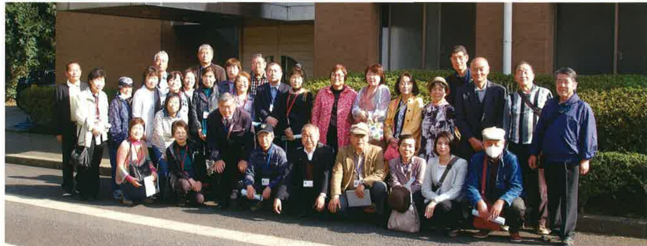
麻薬犬訓練センター前にて

七栄学区 0歳から5歳までの親子を対象に、「ちょっとほっとタイム」パパ&ママの子育てを応援しています。育児の相談や、困りごとなど、人生・子育ての先輩に話してみませんか。きっと安らぎ一息つける時間が持てますよ。「 高齢者のお茶飲み会 」も月1回開催。家にこもりがちな人、話し相手がなく寂しく不安と悩みを持っている人、これからの明るく楽しい、いきいき人生を送る第一歩、どうぞ中部ふれあいセンターにお出かけください。お待ちしております。😊