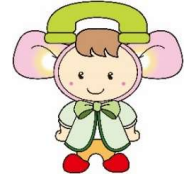
マスコットキャラクター とみリン

消費生活センターでは、衣・食・住など消費生活全般に関する商品・サービスへの苦情や相談について、専門の相談員が公正な立場で問題解決へのお手伝いをしています。相談は無料で、秘密は厳守します。