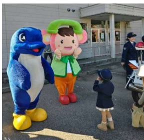
シーポック君が応援に来てくれたよ！