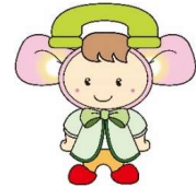
マスコットキャラクター とみリン

消費生活センターでは、衣・食・住など消費生活全般に関する商品・サービスへの苦情や相談について、専門の相談員が公正な立場で問題解決へのお手伝いをしています。相談は無料で、秘密は厳守します。