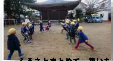
ふるさとまとめて 花いちもんめ