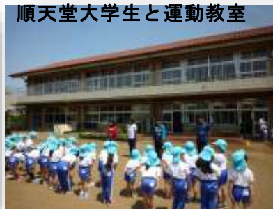
順天堂大学生と運動教室