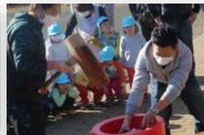
手づくりこいのぼり