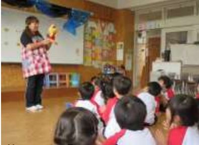
英語活動「ハッピータイム」