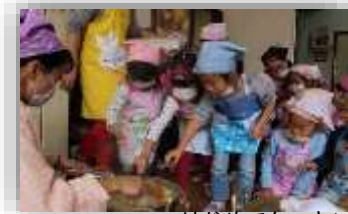
はじめてクッキング (太子幼稚園)