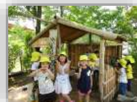
秘密基地「木のおうち」