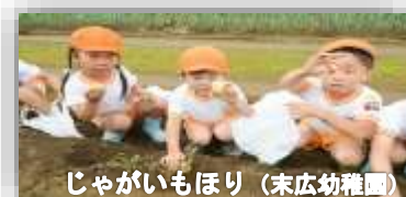
じゃがいもほり (末広幼稚園)