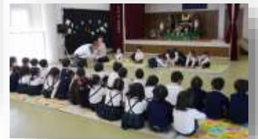
小粒でもキラリと光るひよし森