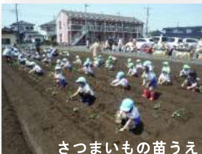
さつまいもの苗うえ