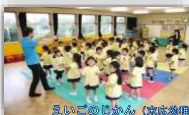
えいごのじかん (末広幼稚園)