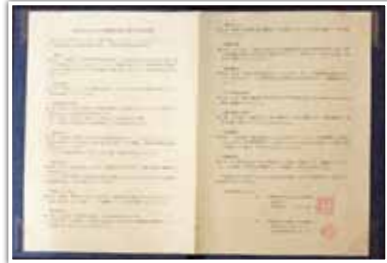
▲株マツモトキヨシと締結した協定書