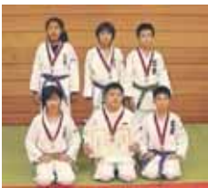
▲団体の部の皆さん