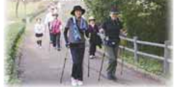
来年も体育の日(10月10日)に開催予定です。皆さんの参加をお待ちしています！

スポーツ 2015とみさとスポーツ健康フェスタ スポーツの秋を満喫！ 10月12日の体育の日に、社会体育館などを会場に、「とみさとスポーツ健康フェスタ」が開催されました。当日は、好天に恵まれ、社会体育館・中央公園を中心として、様々な種目で約340人の参加者がスポーツの秋にふさわしい爽やかな汗を流しました。