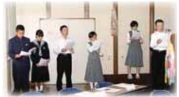
▲発表をする平和学習リーダーの皆さん

27年度富里市平和学習リーダー長崎訪問報告会と戦争体験講話を開催しました。平和学習リーダーは、市内3つの中学校から代表6人が選ばれ、8月8日～10日に長崎市に派遣されました。長崎市では、長崎原爆犠牲者慰霊平和祈念式典への参列や長崎市が主催する平和学習に参加し、全国から派遣された青少年と交流しながら、原爆の恐ろしさ、戦争の悲惨さ、平和の尊さについて学習し、その成果を報告しました。