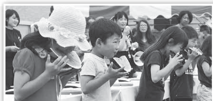
▲あま～いすいか、誰が一番早く食べられたかな?

富里の夏を飾るイベント「すいかまつり」が6月13・14日に開催されました。このイベントは、富里の特産である「すいか」を広く紹介し、品質や技術の向上と共に栽培の更なる振興を目的として毎年行われています。