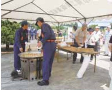
▲防災訓練での炊き出しの様子

6月7日、土砂災害警戒区域等に指定されている中沢地区を対象に、市と中沢区の共催で、市内で初の土砂災害に対する防災訓練を実施しました。