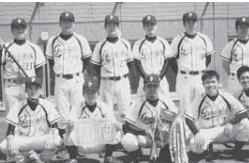
▲原動機工場野球部の皆さん

市春季野球大会が3月22日～4月26日に、富里中央公園野球場・市菅野球場を会場に開催されました。今大会は、第1部15チーム、第2部20チームが参加。うららかな春の陽気の中、各クラスで熱戦が繰り広げられ、選手たちは日頃の練習の成果を競い合いました。各クラスの上位結果は次のとおりです。