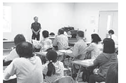
▲栽培方法を学ぶオーナーの皆さん