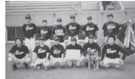
▲キングスの皆さん