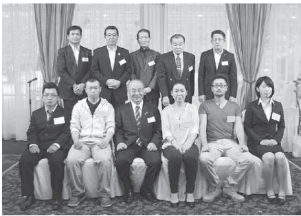
▲これからの富里の農業を支える新規就農者と激励を贈る関係者の皆さん

福祉避難所は、避難所へ避難したものの多くの被災者と一緒で過ごすことで心身への負担が大きい、障がい者や高齢者など、避難所での生活が困難な人を受け入れる避難所です。