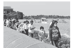
▲おいしい富里スイカを期待しながらの苗選び

富里市の特産物である「富里スイカ」のPRを目的に「富里スイカオーナー制度」を開始しました。4月に富里スイカオーナーを募集したところ、他県からの申込みを含め446件の申込みがあり、応募多数のため、厳正なる抽選を行い50人のオーナーが決まりました。5月17日、オーナーとなった皆さんが集まり、JA富里市とJA富里市西瓜部の協力のもと、富里スイカの栽培方法などのセミナーを開催。またオーナー自らがスイカ畑で自分の苗に礼付け作業を行いました。