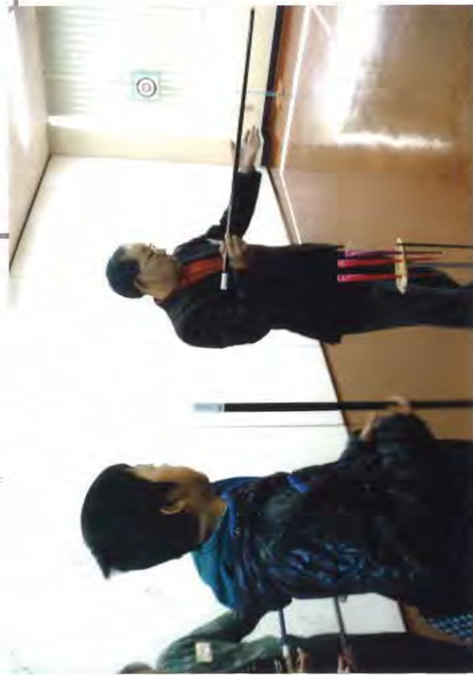
↑吹矢のやり方をあそびてみる

苦勞していることは、なかなか、会員がきてくれないことだそうです。ぼくもやってみたいと思いましたが