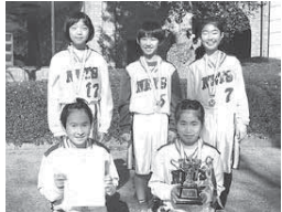
▲高学年女子の部優勝 富里ネットスA