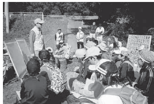
▲生態系について熱心に学習する児童

平成26年10月18日、NPO 富里のホタルの皆さんを講師に迎え、天神谷津(立沢)で谷津田や里山の自然環境を観察しました。生態系について学習したり、昆虫や植物の採集したりと、内容の濃い学習会になりました。学習後はおいしい焼き芋もいただきました。