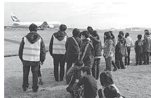
▲大きい飛行機を目の前に騒音測定