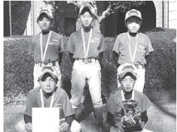
▲低学年の部優勝 富里ラディソンエンゼルスA