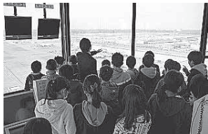
▲成田国際空港の全景を眺める貴重な体験

平成26年12月24日、成田国際空港と航空科学博物館で、成田国際空港側の協力のもと、ランプコントロールタワーやA滑走路の見学を行いました。普段は立ち入ることのできない制限区域内で騒音測定などを体験しました。滑走路脇から離陸する飛行機を目の当たりにして、その迫力に圧倒されていました。