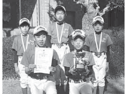
▲高学年男子の部優勝 富里ラディソンエンゼルスA