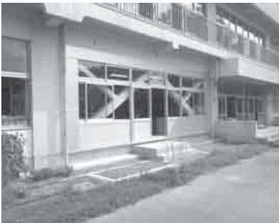
▲より強固となった富里南小学校の校舎