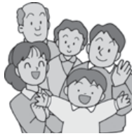
地域の皆さんで支えあうコミュニティづくりを