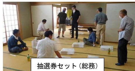
抽選券セット(総務)