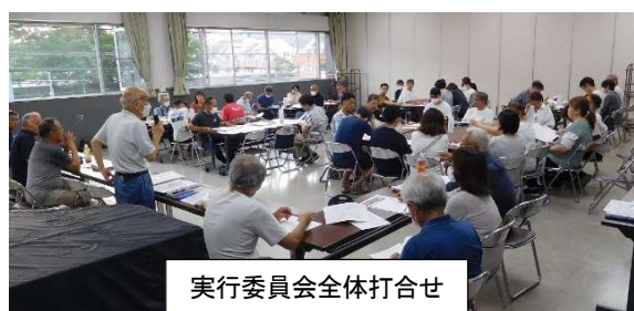
実行委員会全体打合せ