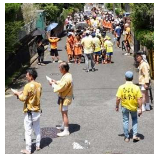
子ども山車・御輿付き添い