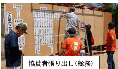
協賛者張り出し(総務)