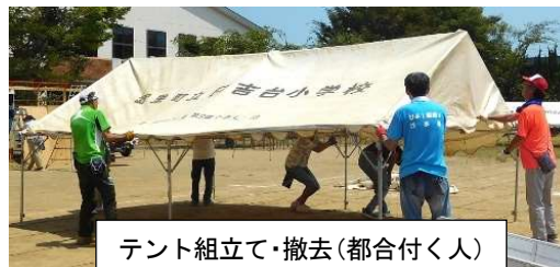
テント組立て・撤去(都合付く人)