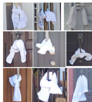
玄関ドア付近に白いタオル

富里市の犯罪認知件数(富里市防災・防犯メールベース)が急増しています。1月から6月までは8~12件で推移していました。ところが、7月以降、16件、37件、21件、33件(10/31まで)と増加しています。日吉台小学校区でも10月には窃盗事件が9件発生(未遂を含む)しています。センサーライトや防犯カメラ等を設置するなど、犯罪被害防止に努めましょう。