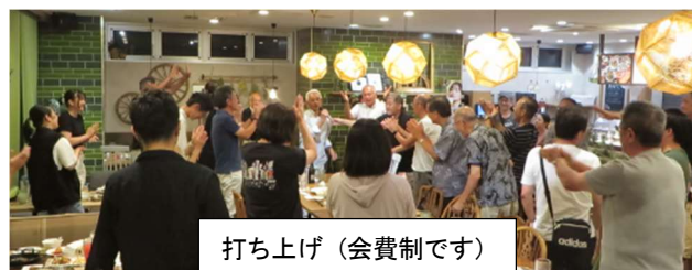
打ち上げ(会費制です)